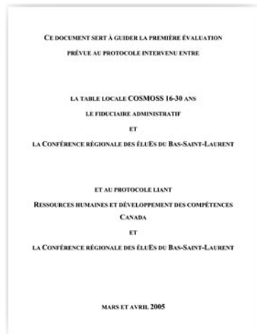
Document d'évaluation fourni par le comité technique régional