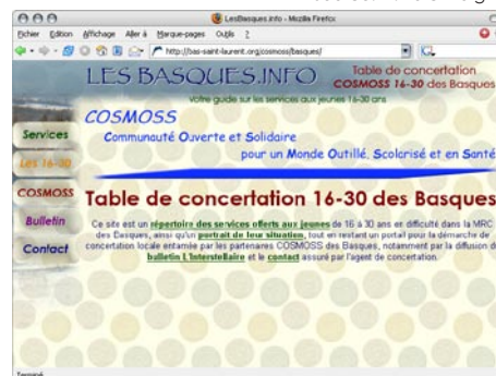
Le portrait sera un site Internet simple

les compléter ou corriger au besoin, avant leur mise en ligne officielle.